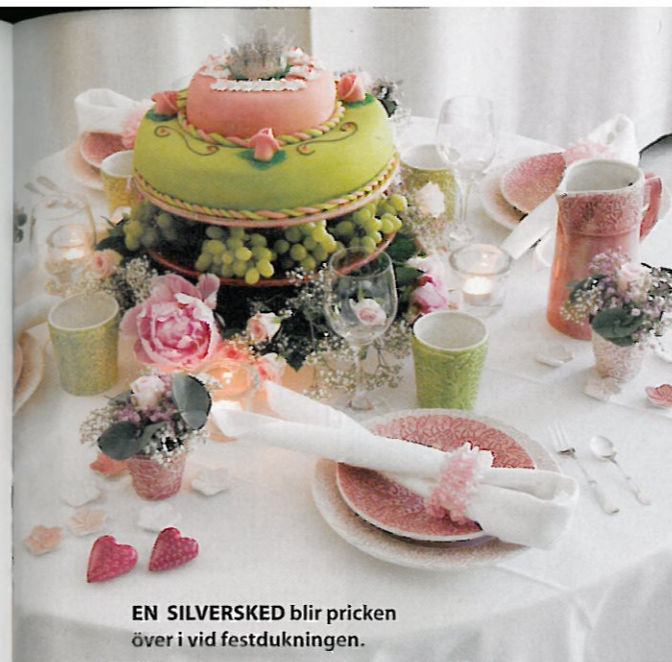
EN SILVERSKED blir pricken över i vid festdukningen.

Både kniven och skeden har funnits sedan urminnes tider