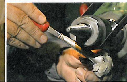
ATT GÖRA EN enda silverkniv kräver 32 olika arbetsmoment.

men kniven sägs vara den äldsta delen. Den började användas redan under medeltiden och då skar man med höger hand och stoppade maten i munnen med den vänstra.