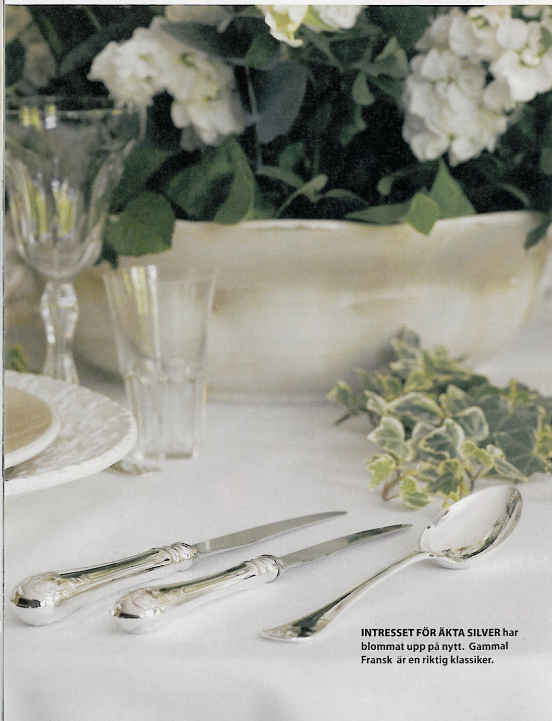
INTRESSET FÖR ÄKTA SILVER har blommat upp på nytt. Gammal Fransk är en riktig klassiker.

Människan har i alla tider helst stoppat i sig maten med fingrarna. Först på 1500-talet började man äta med kniv och gaffel och besticken blev vardagliga bruksföremål. I dag dukar många gärna med finsilver.